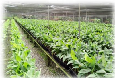
Vitroplantas de bananos y plátanos