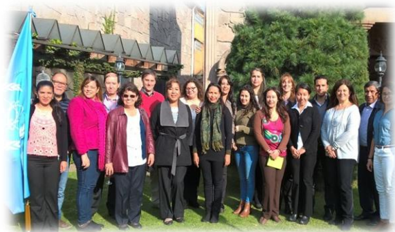
Capacitación en determinación de las vías de dispersión por la que se pueden contaminar por residuos de plaguicidas, México