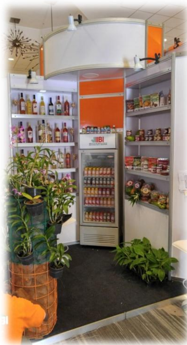
Estante del IIBI en Feria Agroalimentaria