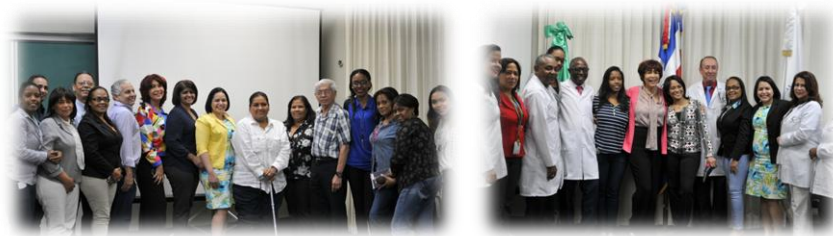
Personal participante en auditorias DNV-GL y ODAC

sistema y para los ensayos ya acreditados, destacándose el gran compromiso del personal con el mantenimiento del SGC y la integración de la alta dirección y todo el personal.