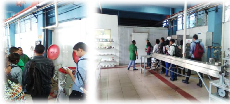
Estudiantes universitario visitando la planta piloto