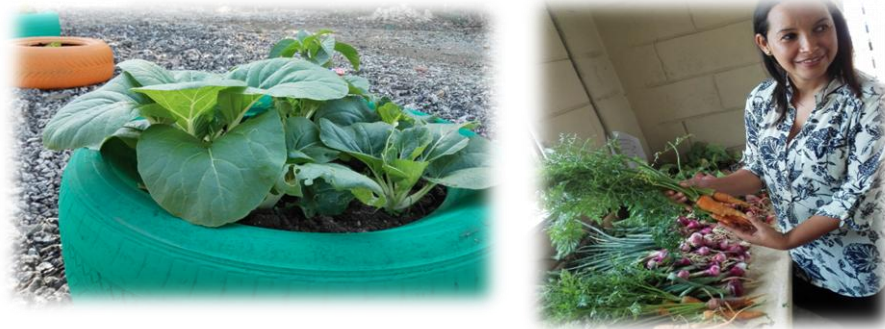
Plantas cultivadas con el uso de fertilizantes biológicos

Pleurotus florida y Psathyrella copriniceps (Yonyon), siendo esta última especie