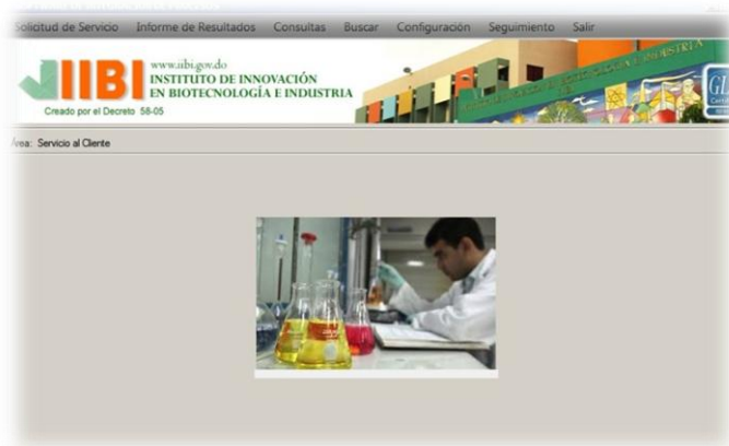
Plataforma para cálculos e informe de resultados

determinación, módulos de revisión y módulos para generar el informe de resultado final. Todo con una mínima intervención humana.