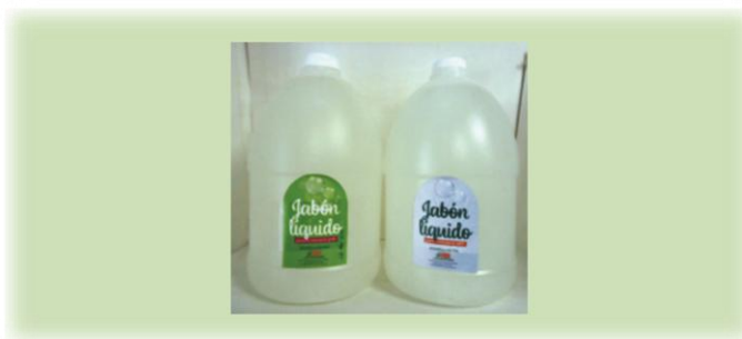
Jabones y detergentes desarrollados