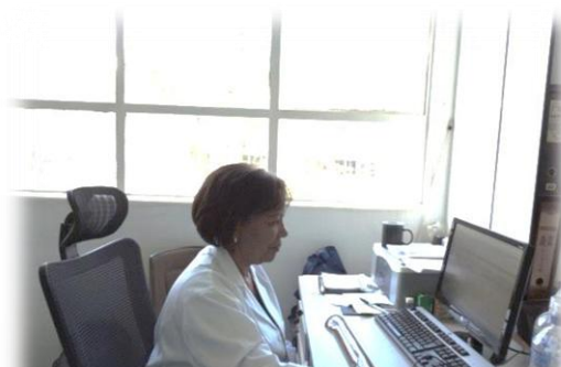
Capacitación Colombia en determinación de Residuos de Plaguicidas en leche materna