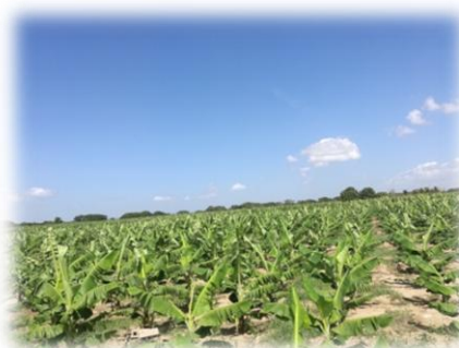
Plantación bananos, Línea Noroeste