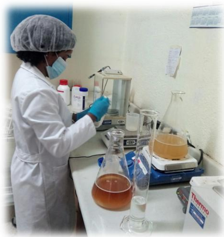
Estudiante de doctorado en labores de investigación