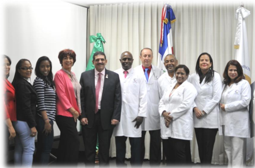
Personal auditado del IIBI y auditores del ODAC