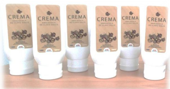
Crema analgésica de clavo dulce

en nuestro país, para la extracción de aceites esenciales, ha permitido ampliar el potencial de fabricación de cosméticos, medicamentos, detergentes a partir de las mismas. Ejemplo de estas son nuez moscada, boldo, albahaca, ruda y tomillo.