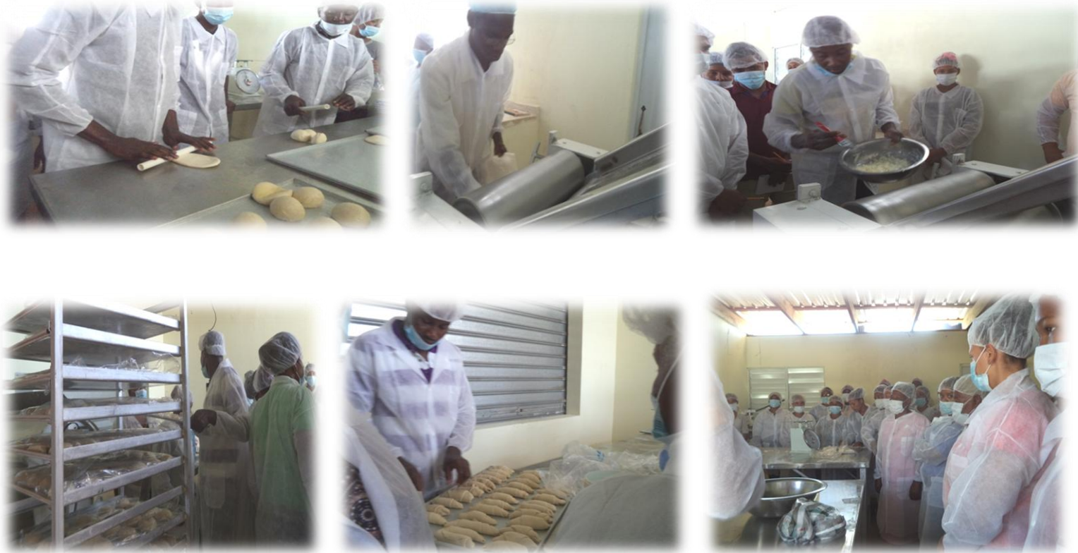
Entrenamiento en elaboración de panes, Boca de Cachón, provincia Jimaní