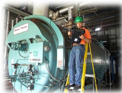
Técnicos del IIBI realizando mediciones

En el área de Biotecnología Industrial, se realizaron 25 solicitudes de servicios de Etiquetado Nutricional con un total de 89 productos a igual número de empresas. Con este servicio el IIBI contribuye con las empresas alimenticias para el cumplimiento con la normativa nacional sobre etiquetado. Otro servicio de impacto para la industria alimentaria nacional lo es la Inspección Higiénica Sanitaria, con la cual se contribuye a detectar oportunidades de mejora en las plantas de producción con respecto a la inocuidad alimentaria. Asimismo, se realizaron 2 servicios de Evaluación Sensorial de Alimentos a igual número de empresas, en los cuales se evaluaron 2 productos (leche y Jarabe).