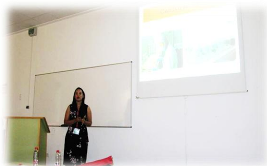
Presentación Congreso de Emprendimiento, medioambiente y Energía Renovable, Portugal