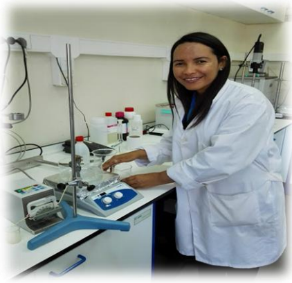
Curso microencapsulación, Instituto Politécnico de Braganca, Portugal

Curso de Microencapsulación, Instituto Politécnico de Braganca, Portugal