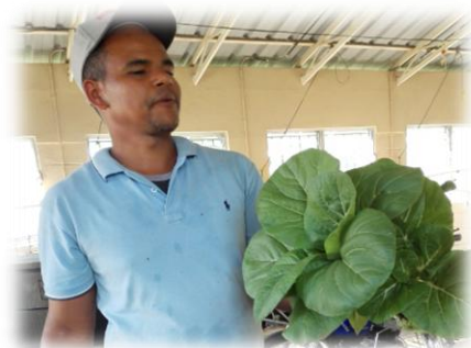
Plantas cultivadas con el uso de fertilizantes biológicos

Se desarrollan enmiendas orgánicas que mejoran las características del suelo que, combinadas con hongos y otros microorganismos promotores del crecimiento, permiten mejorar la fertilidad del suelo y la supervivencia de las plantas en zonas degradadas. Los hongos, junto con otros microorganismos