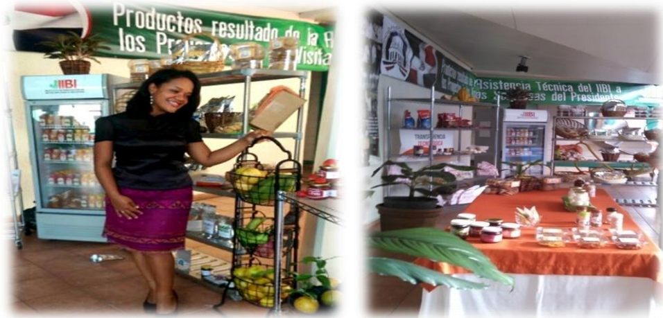
Feria Aniversario de la institución