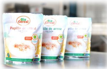
Productos elaborados en planta piloto