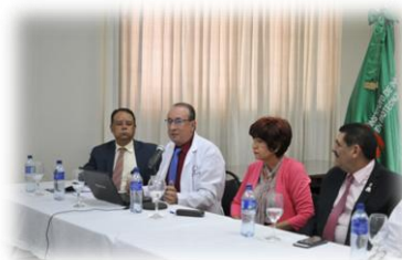
Reunión de cierre de auditoría ODAC

En los días del 4 al 6 de diciembre el Instituto además, postuló dos nuevos ensayos en coordinación con el Organismo Dominicano de Acreditación (ODAC), en el que participaron expertos técnicos extranjeros y un equipo evaluador del ODAC. Se destacó nuevamente el compromiso demostrado por la Alta Dirección y todo el personal para el mantenimiento y desarrollo del Sistema de Gestión de Calidad y para con el cumplimiento de los requerimientos de los clientes, los legales y reglamentarios, la capacidad técnica del personal en los ensayos evaluados y el manejo digital de la documentación