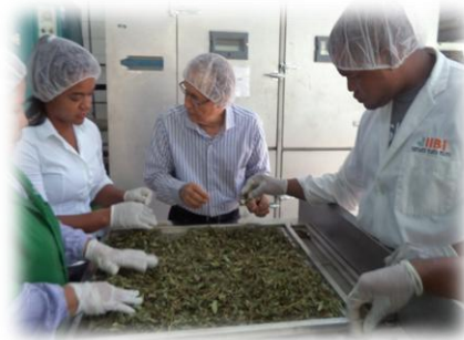
Técnicos laborando en la planta piloto del IIBI

El área de Biotecnología Farmacéutica durante el año 2017, desarrolló 7 nuevos productos basados en la etnobotánica, tales como, crema antimicótica de orégano y crema antiinflamatoria de clavo dulce y aceites esenciales. El uso de plantas medicinales, de nuestra flora endémica y otras introducidas y cultivadas