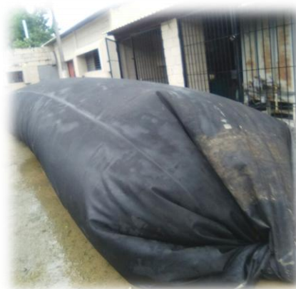
Digestor para el proyecto IIBI/ CNE de Guanuma, Monte Plata

Por otra parte, se realizaron asistencias técnicas a dos empresas para construcción de digestores para procesar el estiércol bovino. Se formuló con la Comisión Nacional de Energía (CNE) un proyecto cuyo objetivo es el diseño e instalación de un sistema de biodigestores en una pequeña ganadería bovina, en la comunidad Guanuma en la Provincia de Monte Plata. Actualmente se está construyendo el digestor en las instalaciones del IIBI como se ilustra en la siguiente foto.