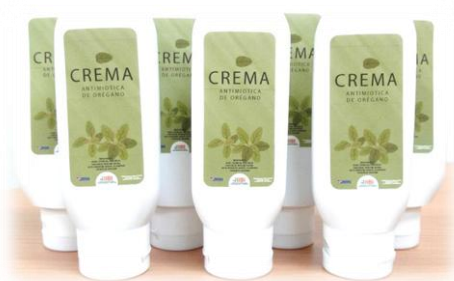
Crema antimicrobica de orégano