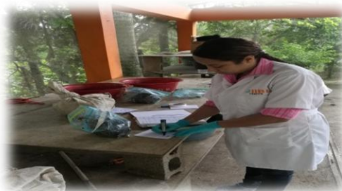
Investigadora del IIBI del proyecto marcadores moleculares en banano para resistencia a Fusarium oxisporum . IIBI-