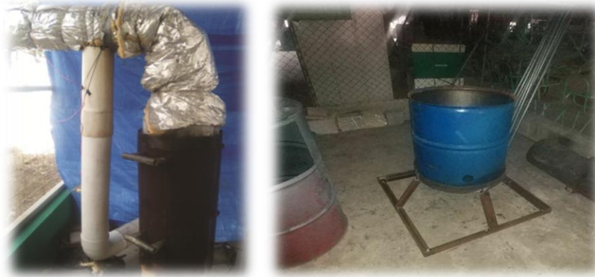
Gasificadores de desechos agrícolas para generar calor

país desde los puntos de vista ambiental y económico, reduciendo notablemente el consumo de combustible tradicional y carbón vegetal.