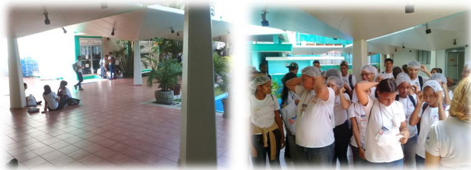
Visita Estudiantes Bachillerato al Centro de Investigación para la Industria Alimentaria