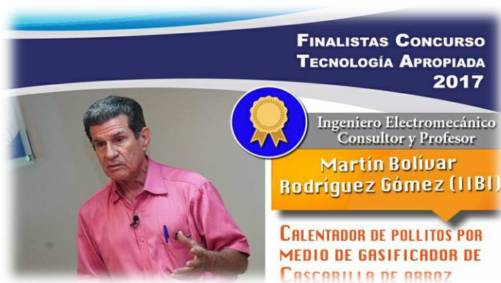
Participación Concurso Tecnología Apropiada 2017 ONAPI