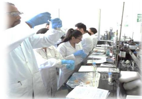
Capacitación en determinación de Residuos de Plaguicidas en leche materna, Colombia