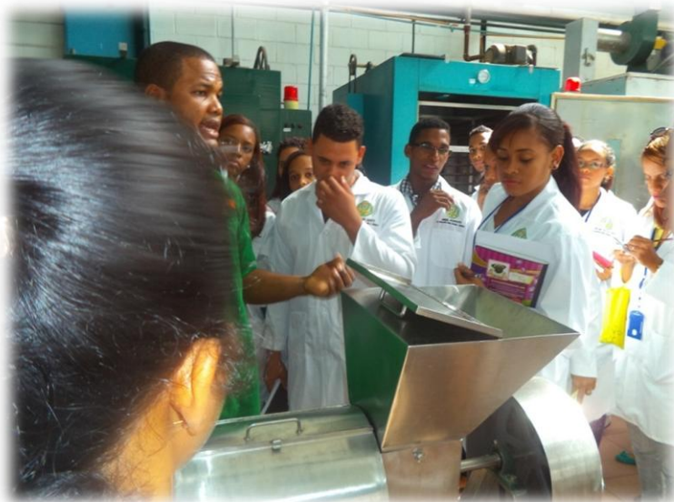
Visita de estudiantes de la INTEC, de la carrera de biotecnología