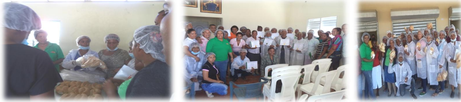
Entrenamiento en elaboración de panes, Boca de Cachón, provincia Jimaní