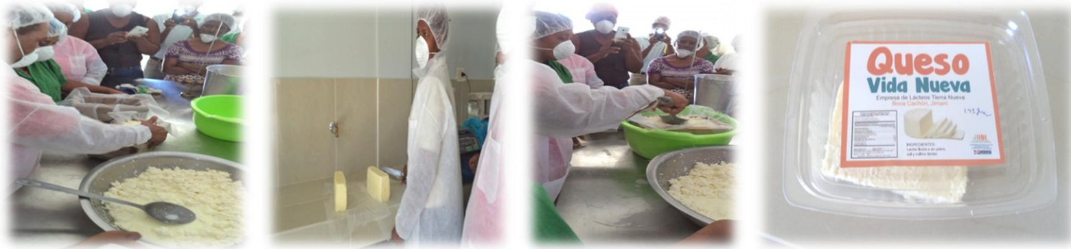
Entrenamiento en elaboración de quesos y yogurt, Centro de Madres Las Desamparadas, Tierra Nueva, provincia Independencia