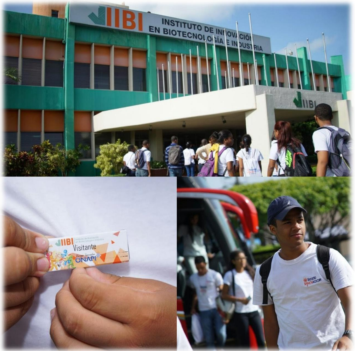
Visita Campamento Verano innovador ONAPI