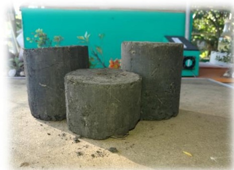
Briquetas de Carbón de Residuos Agrícolas

Se utilizaron otras fuentes de biomasa tales como: aserrín con carbón, Bagazo de coco, Bagazo de orégano, cascarilla de café, algas marinas, bagazo de caña de trapiche, hojas de la caña y hojas de plátano/guineo. Algunas briquetas elaboradas no lograron buena consistencia por falta de compresión, gran tamaño y aglutinante no adecuado. Sin embargo, en otras se logró buen aglutinamiento, adhesión, consistencia y poder calorífico, así como buen desempeño en la estufa de prueba. Para mejorar la calidad de las briquetas se carbonizó el material mediante el uso de un gasificador y se procedió a mezclar con un aglutinante orgánico que resultó muy efectivo. Las briquetas obtenidas resultaron de muy buena calidad y apariencia, como se muestra en la foto siguiente.