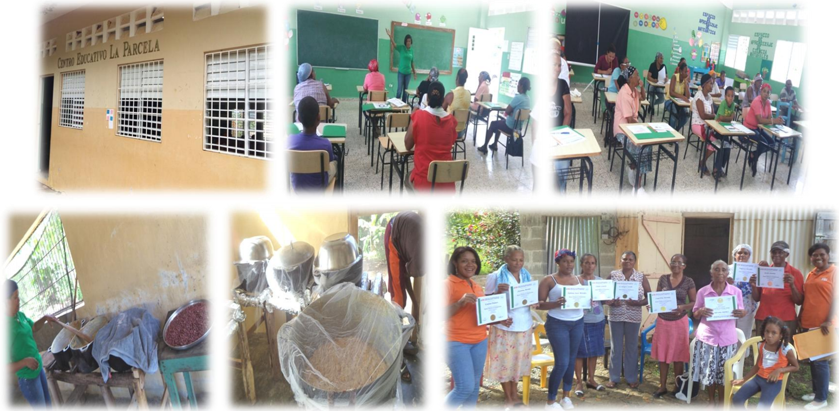
Entrenamiento en producción de dulce de leche, Asociación de Mujeres Nuevo Amanecer, la Parcela, El Seibo