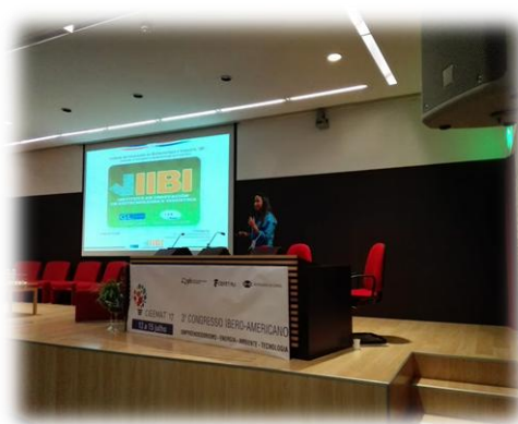
Presentación congreso de biotecnología, en Murcia, España