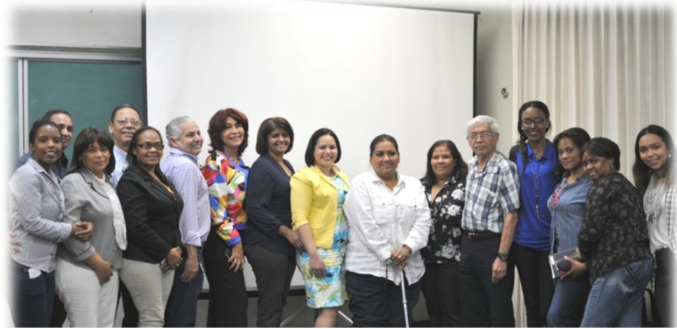
Personal auditado del IIBI y auditora DNV-GL