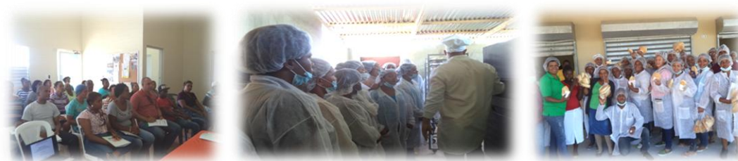
Entrenamiento en elaboración de panes