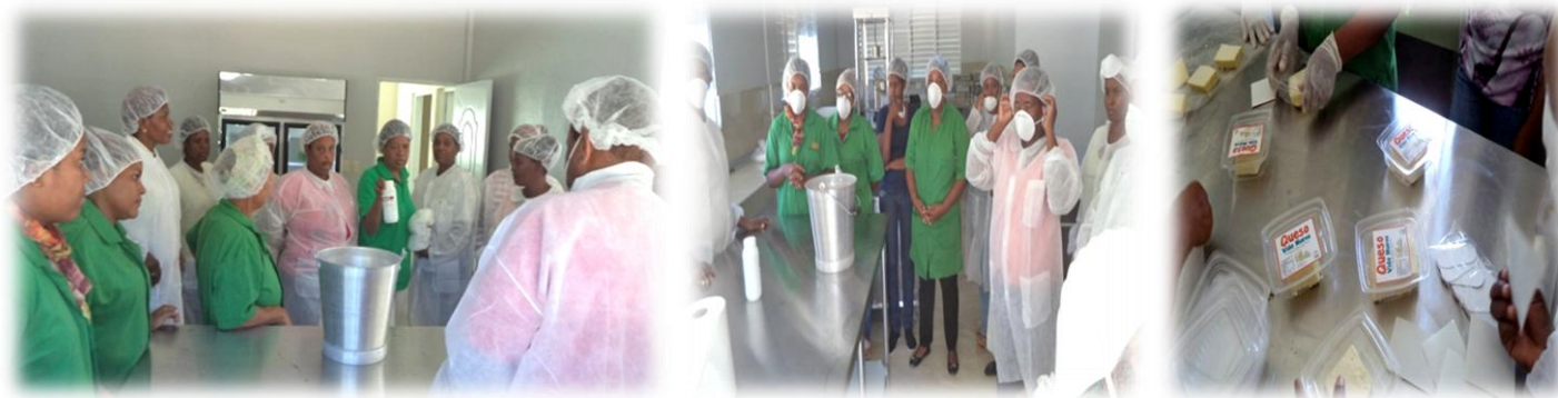
Entrenamiento en elaboración de quesos y yogurt, Centro de Madres Las Desamparadas, Tierra Nueva, provincia Independencia