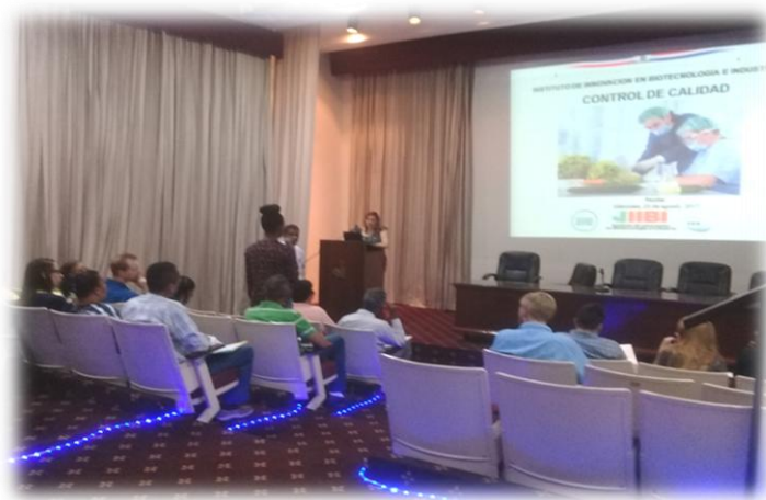
Charla sobre Control de Calidad en la elaboración de productos alimenticios, Cuerpo de Paz