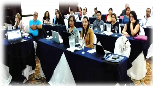
Capacitación en evaluación de diferentes matrices contaminada por residuos de plaguicidas, Costa Rica