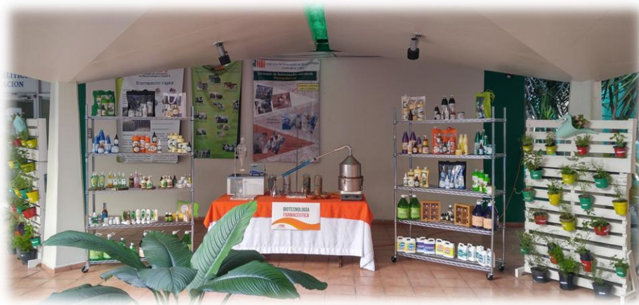
Exhibición de productos de Biotecnología Farmacéutica en Feria de Aniversario IIBI

A estos productos elaborados se le realizaron todas las analíticas correspondientes (Físico-Químicas y Microbiológicas) y los mismos cumplen con las normas y exigencias internas de calidad del Instituto y del país.