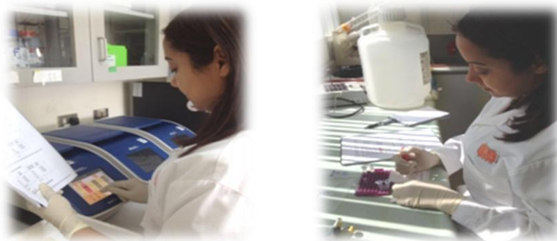
Actividades de Investigación en Biotecnología Vegetal

Durante el 2017, continúan en desarrollo 5 líneas de investigación relacionadas y producción. 1) Marcadores moleculares buscando resistencia al hongo Fusarium oxisporum en musáceas, 2) Marcadores moleculares para la búsqueda de resistencia al hongo Phytophthora infestans en papa 3) Producción de hongos comestibles usando desechos agroindustriales, 4) Aislamiento de genes para resistencia a salinidad y sequía y 5) Propagación masiva in vitro de musáceas, raíces y tubérculos. Todos estos tópicos de investigación se generan ante el interés de dar respuesta a problemáticas importantes de la agropecuaria nacional, siempre en beneficio de nuestros agricultores.