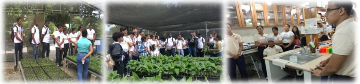
Estudiantes de colegios y universidades visitando el Centro de Biotecnología Vegetal (CEBIVE)