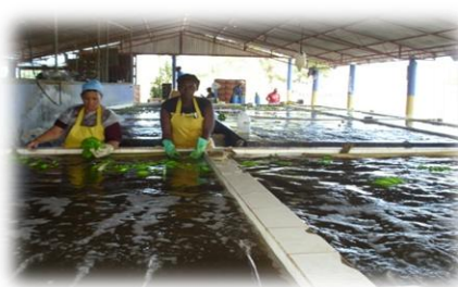
Bananos procedentes de vitroplantas del IIBI, para exportación