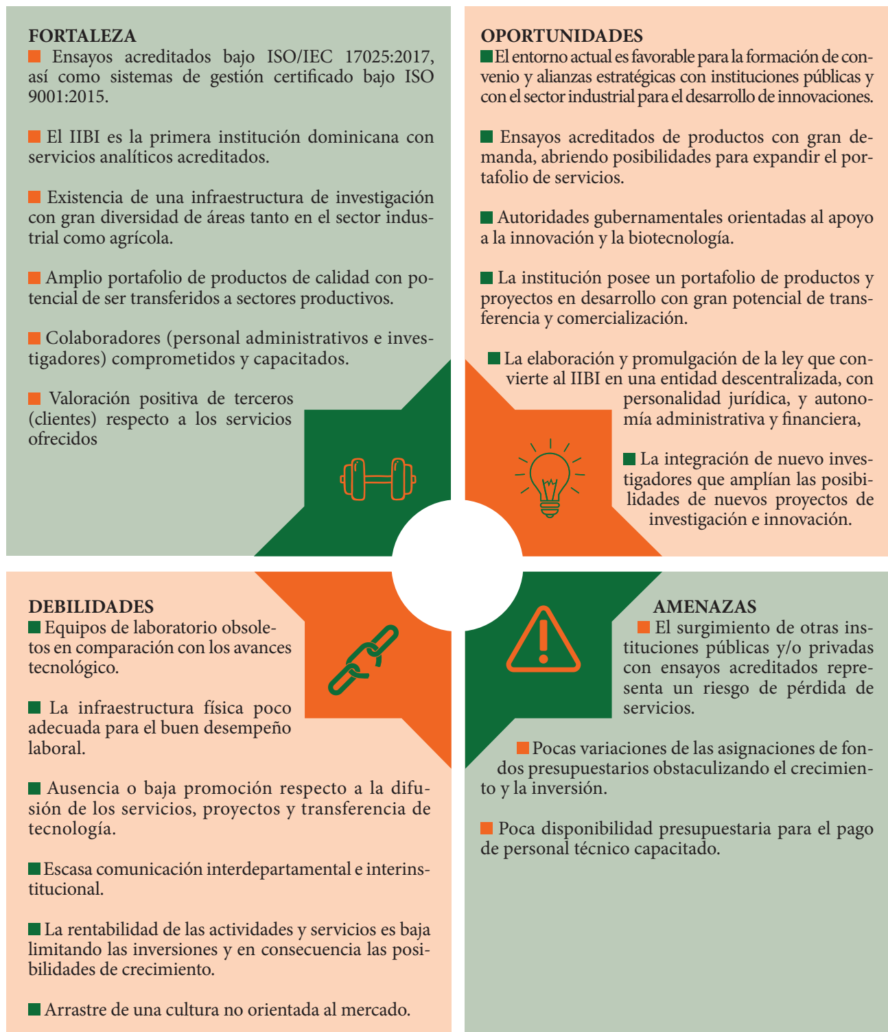
CUADRO 1: ANÁLISIS FODA: FORTALEZAS Y OPORTUNIDADES